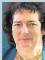
Lindsey Davis Némesis

GRUALBO / ROSA DELS VENTS 896 / 816 PÁGINAS 22,90 EUROS